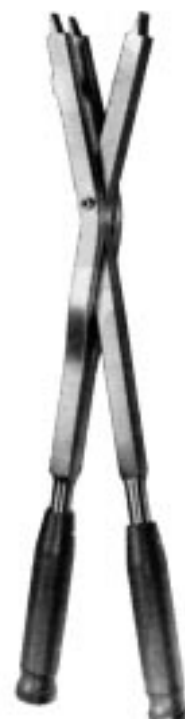
HERMANN 21.0150 46 cm