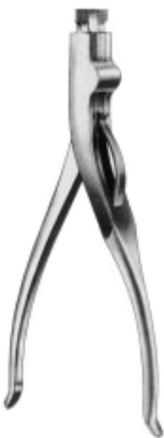
WALTON 21.0130 23 cm