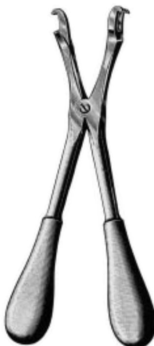
STILLE-HAGLUND 21.0140 28 cm