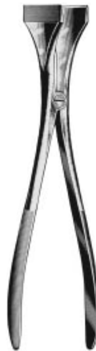
HENNING 21.0120 27 cm