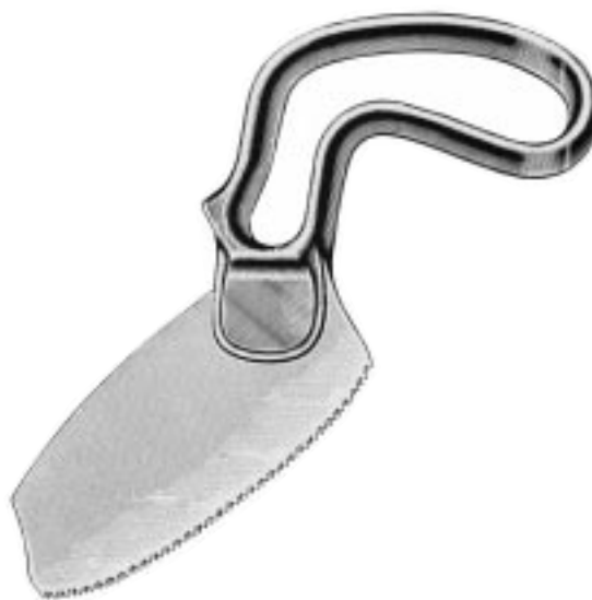
BERGMANN 21.0070 23 cm