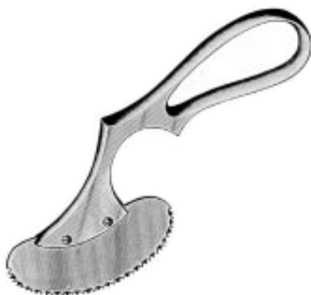
ENGEL 21.0060 16 cm